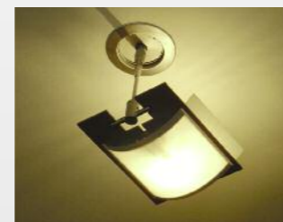
Individuelle Beleuchtung: Ambiente und Gemütlichkeit durch perfekt abgestimmte Lampen und Leuchtmaterialien.