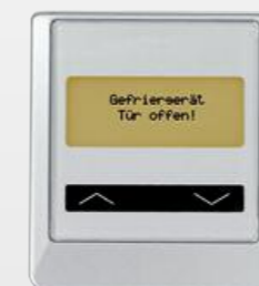
Wichtige Informationen und Statusanzeigen über elegante Schaltersteuerungen.