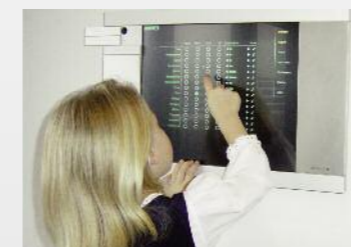
Die kinderleichte Bedienung des Gebäudemanagements über das Touch-Panel ist jederzeit garantiert.

Sind Waschmaschine oder Trockner fertig? Vorbei die Zeit, als Sie im Keller nachschauen mussten. Fragen Sie doch einfach vom Wohnzimmer aus den Status der Heizung ab – dazu müssen Sie nicht mal aufstehen. Das intelligente Gebäudesystem gibt Ihnen ein sicheres Gefühl, auch wenn Sie unterwegs sind.