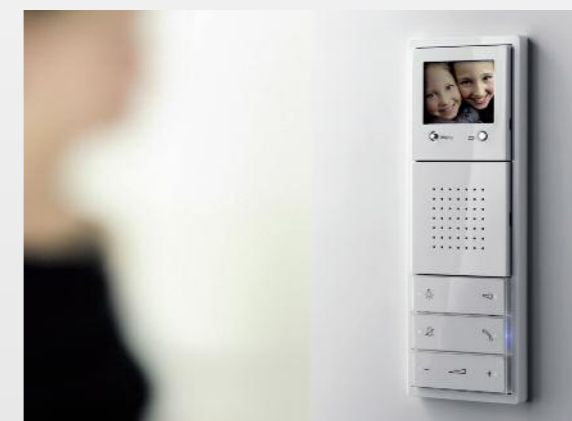
Auf einen Blick: Komfortable Türkommunikation im eleganten Schaltdesign.

Aber auch Störungs- und Diagnosemeldungen sind ein wichtiges Sicherheitsfeature: Kontrollieren Sie den Heizölstand, informieren Sie sich, ob das Wasser abgestellt oder das Licht ausgeschaltet ist. Sie haben jederzeit von unterwegs Zugriff auf Ihr Haus – als ob Sie zu Hause wären.