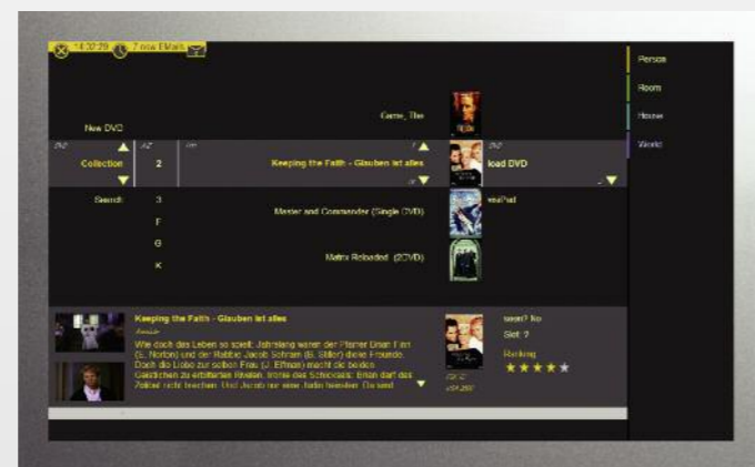
Die integrierte Steuerung des Multiroom-Systems bietet größtmöglichen Komfort.

Legen Sie die neue CD ein und nur wenig später ist sie schon inklusive Songtitel auf dem Server gespeichert und überall verfügbar. Erzeugen Sie Playlisten mit Ihren Lieblingsongs und erstellen Sie mp3-CDs für das Auto - minimaler Aufwand für maximalen Komfort.